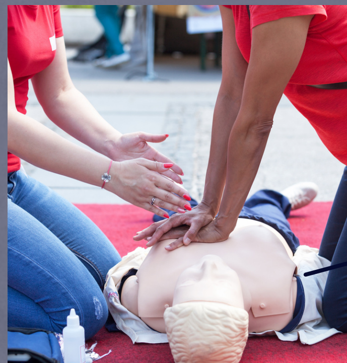
CHARLAS - TALLERES INFORMACIÓN Y FORMACIÓN

Reparto de marcapáginas con la incorporación de códigos QR con información detallada sobre la charla/taller