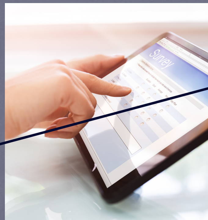
ENCUESTAS ENFERMERAS Y GENERALES