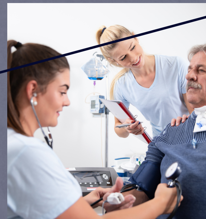
PRUEBAS DIAGNÓSTICOS IN SITU